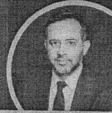
Thiago Martins Cuterres Procurador do Ministério Público de Contas (TCE/RN)